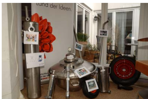
Die KKM als Prototyp

Als besondere Highlights präsentieren sich zwei ambitionierte Jugendprojekte mit ihren Arbeiten.